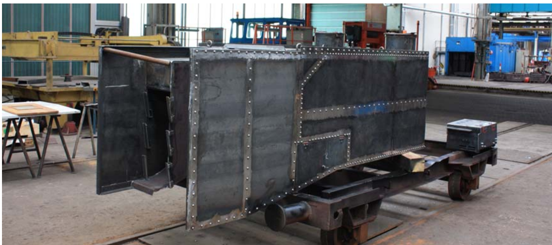
Zum Schluss noch ein Schmeckerchen für alle Nietenzähler