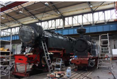
Groß kann jeder ! Aber das Kleine, Feine ...