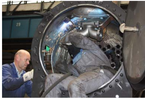
Beim Endspurt noch mal voll reinhängen ...