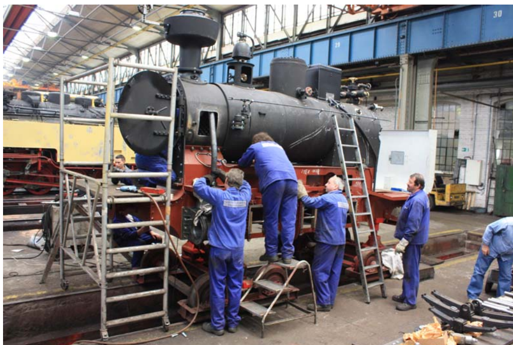
Alle verfügbaren Männer helfen mit, den Fertigstellungstermin zu halten - Danke DLW!