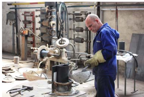
Beim Lagerausguss über die Schulter geschaut