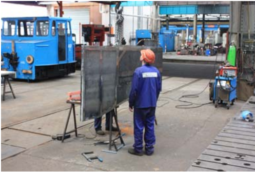
Irgendwas fehlt hier?!