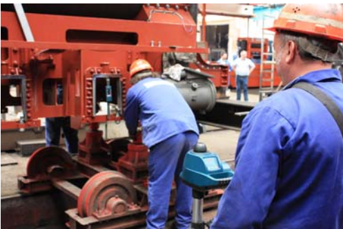
Handgemacht mit höchster Präzision