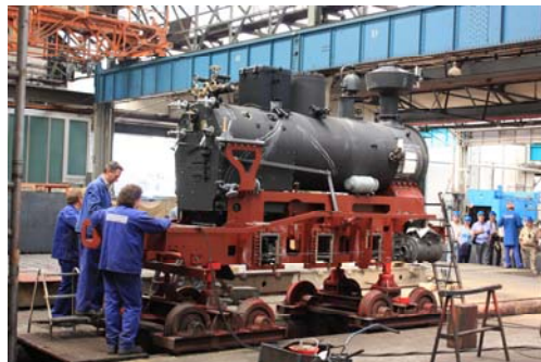
War die I K jetzt ein 3- oder 4-Achser ?