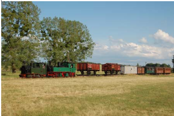
Im Juni 2012 weilte die I K Nr. 54 bei der Lößnitzgrundbahn. Gemeinsam mit der Lokomotive IV K 176 bespannte sie einen Fotozug mit Wagen aus der Epoche der Königlich Sächsischen Staatseisenbahnen.

Informationen zur DAMPFBAHN-ROUTE Sachsen erhalten Sie beim Messteam an der I K Nr. 54 sowie im Internet unter www.dampfbahnroute.de .