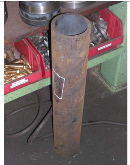
KSV und Abschlammventil hinten, Speiseventile vorn Rechts: Rohr für Gruppenventil