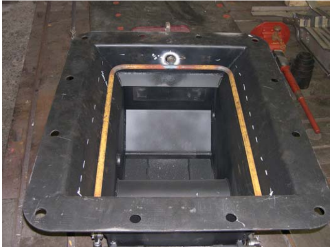
Die Aschkastenspritze wird zum Einbau an den Aschkasten angepasst.

Alle Aufnahmen: 5.5. und 7.5.2009 / Jörg Müller und Frank Reißig Aktueller Stand der Arbeiten / Ansichten von Einzelteilen und Baugruppen