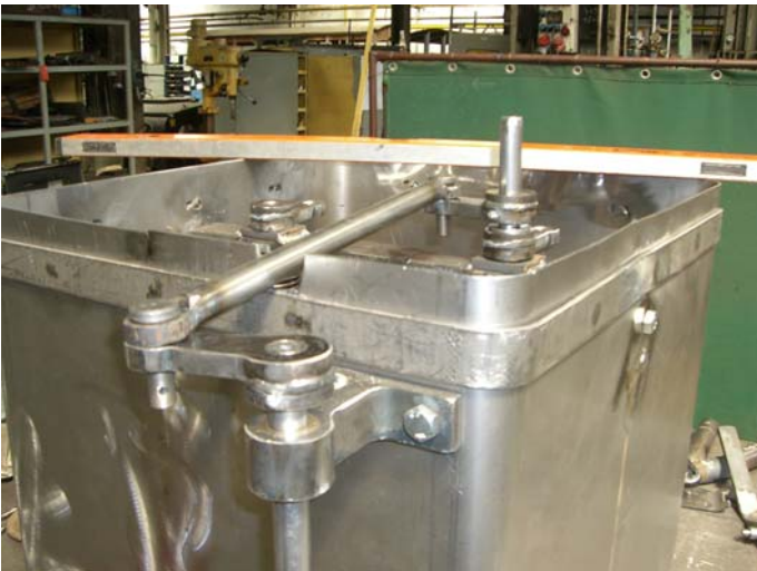
Die Betätigungsmechanik für den Sandkasten wird montiert.