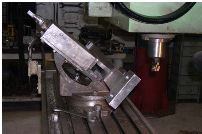
Endbearbeitung der Gleitbahnträger auf der Fräsmaschine.