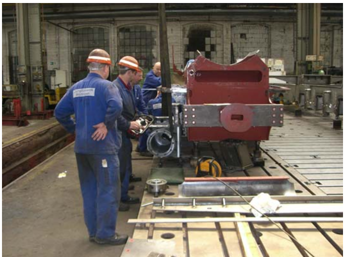
Mit dem Anbau der Zylinder an den Rahmen wurde begonnen.