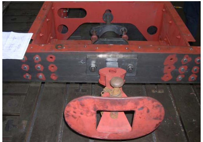
Die Zug- und Stoßvorrichtung wurde in den Rahmen eingebaut.