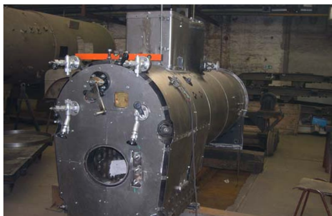
Die Verkleidungsbleche werden an den Kessel angepasst.