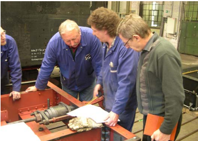
„Diskussion am Objekt.“