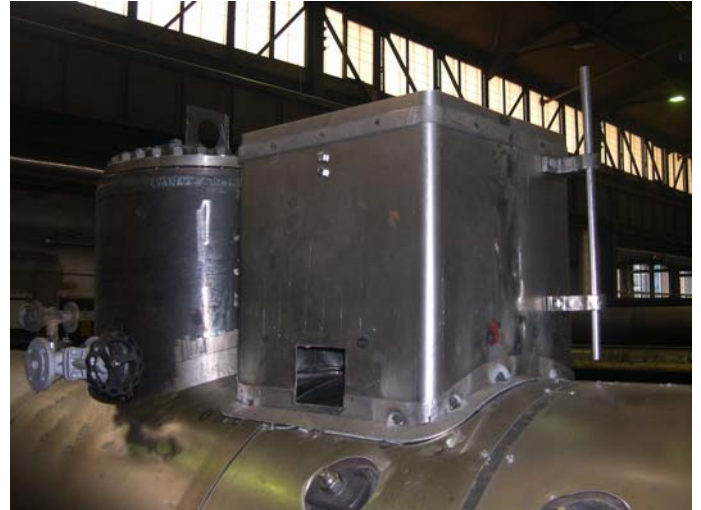
Anpassung des Sandkastens auf dem Kesselscheitel.