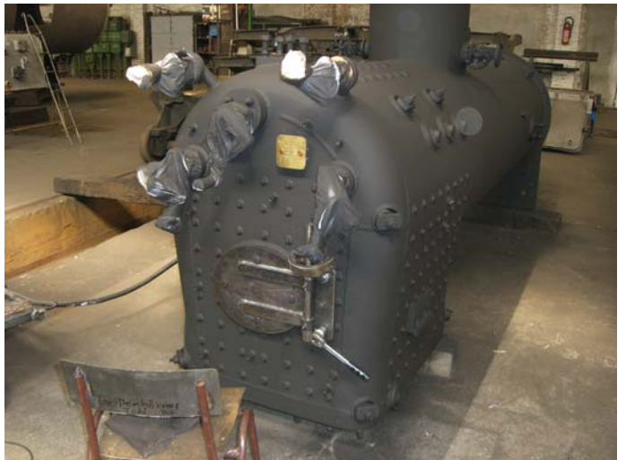
Der Kessel ist grundiert, die Feuertür wird an der Stehkesselrückwand angepasst.