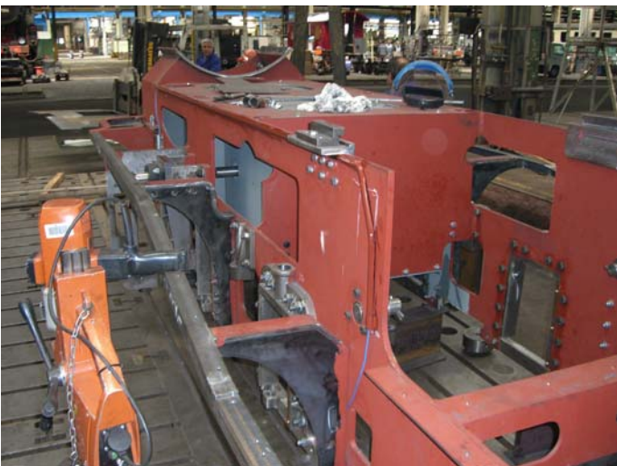
Anbau des Stahlpanzerrohres für das Elektrokabel an der linken Rahmenwange.